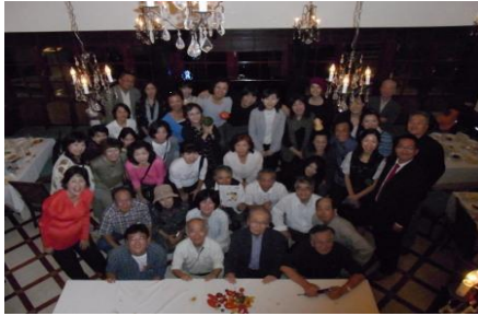
(トマトフェスタの散会前記念撮影)