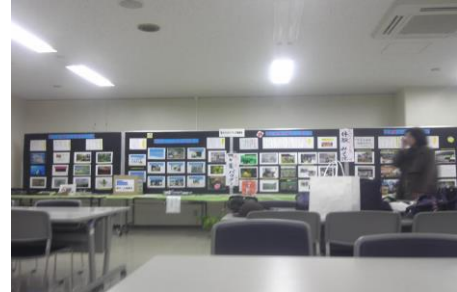
（数年前のトマトの会の展示）

トマトの会は、農業を最も重要な産業と考え、まじめな農家をご紹介します、その働き方を学び、あわせて、トマトの会が設営してきた多摩川まるしえにご紹介してきたことは御承知の通りです。今回は実行委員会のご指導を受けて、例年ご紹介して人気メニューのトマトスムージーをご披露する予定です。