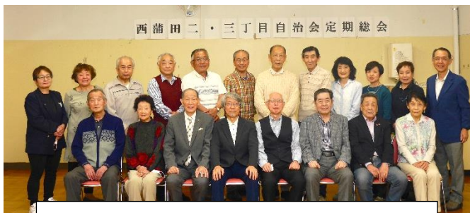
記念写真撮影時のみマスクを外しました。

4月23日18時より定期総会がふれあいはずぬま会議室で開催されました。出席者全員マスクを着用し三密防止対策を講じて、役員、地区部長さんなど計21名が参加しました。